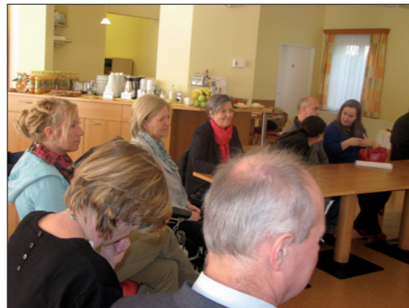
Workshop am 27. Oktober 2014

Im Herbst 2014 wurde ein Workshop für Organisationen und Einrichtungen in Zusammenarbeit mit dem Klagsverband angeboten. Neben einem Überblick über die rechtliche Situation und Lücken im Gesetz, standen die Erfahrungen aus der Beratungspraxis der AD-Stelle sowie strukturelle Problemlagen und deren Lösungsmöglichkeiten am Programm. Ein Austausch und eine Vernetzung bezüglich konkreter Vorfälle in den Einrichtungen rundeten den Workshop ab.