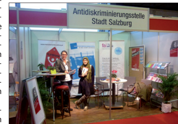
Informationsstand Berufsinformationsmesse 2014

Die Mitglieder der Arbeitsgruppe werden sich weiterhin für strukturelle Maßnahmen einsetzen, um neben der Sensibilisierung und Aufklärung von Betroffenen auch bei ArbeitsmarktakteurInnen, bei MitarbeiterInnen in der Lehr-