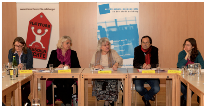
Pressekonferenz am 27. November 2014

der Wohnungssuche benachteiligt fühlten. Inwieweit bei der Wohnungsvergabe durch das Wohnungsamt in der Stadt Salzburg Diskriminierung eine Rolle spielte, konnte nicht geklärt werden. Von Seiten der AD-Stelle wurden die KlientInnen über das Vergabesystem aufgeklärt und eine Vernetzung mit zuständigen Stellen forciert.